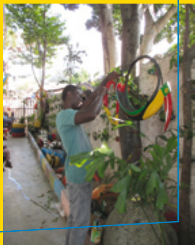
Crèche Nid d'Espoir, Port au Prince

Trois thèmes sont discutés avec les responsables des crèches :