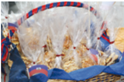
Petites gaufres dans un panier «habillé» aux couleurs d'Haïti