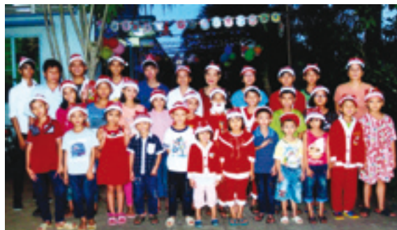
Noël à HUONG DUONG

Depuis 20 ans que l'association apporte de l'aide sur place au Vietnam de nombreux jeunes ont fait des études supérieures, trouvé du travail et fondé une famille.