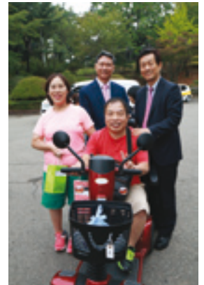
Une voiturette attendue !

Nous remercions tous les parrains et les donateurs qui ont contribué au financement de ce matériel. Nous espérons vivement que des projets analogues pourront être réalisés en 2017 et comptons sur votre participation.