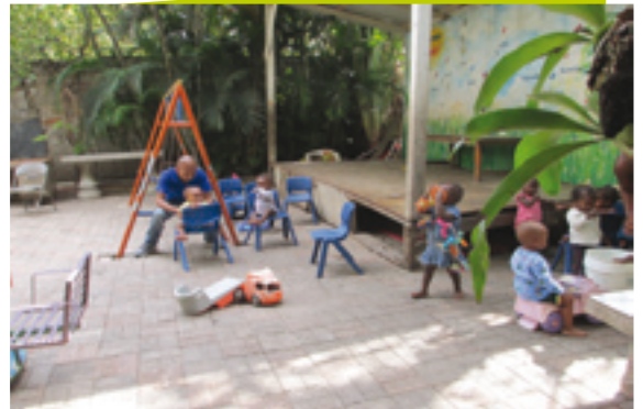
Temps de jeu à la Crèche Myheber, Port au Prince

Il existe un projet de formation en direction des « nounous » qui repose sur une large acceptation et demande des responsables de crèches. Cette formation concernerait la stimulation physique des enfants pour permettre un meilleur développement.