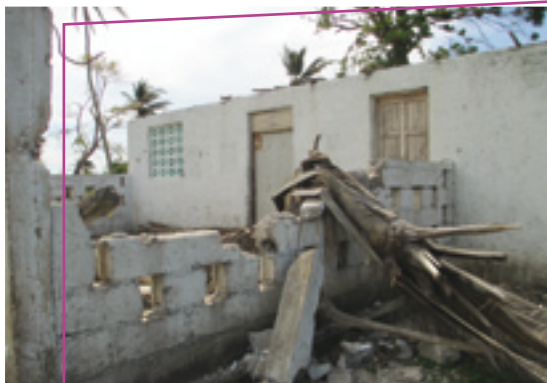
Crèche de Torbeck