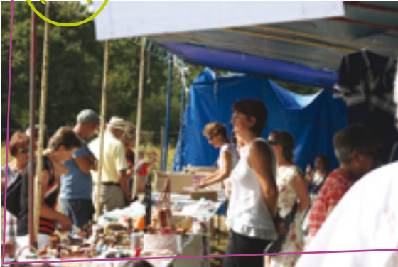
Artisanat et livres : à vos emplettes !