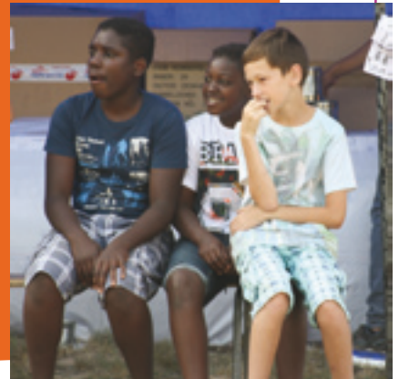
Repos bien mérité après une chaude journée !