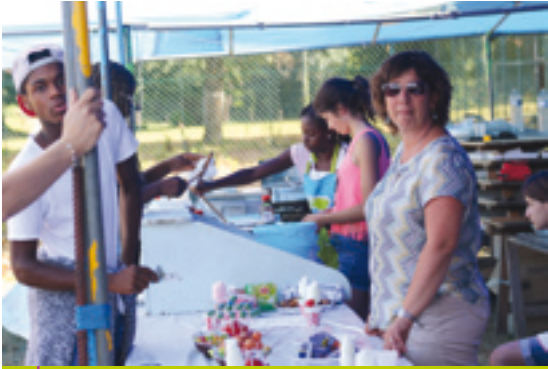
Le coin des gourmands, un peu dévalisé !